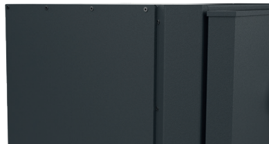
FINITION RIVETÉE SPÉCIALE « ACIER GALVANISÉ ANTI-ROUILLE »